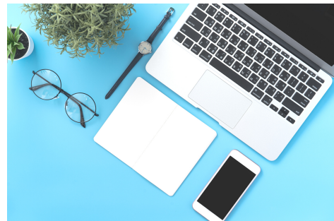
Français secondaire 5