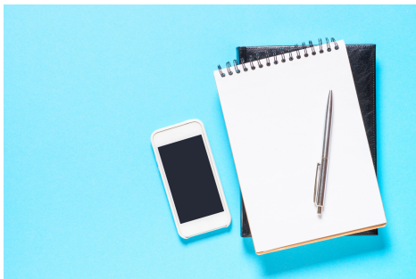
Français secondaire 4