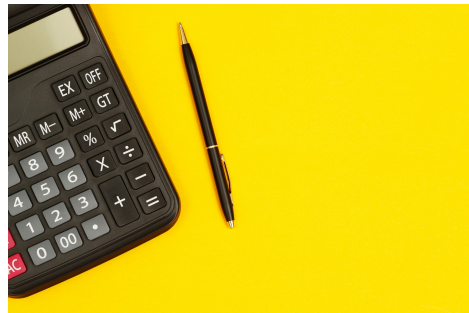
Mathématiques secondaire 3