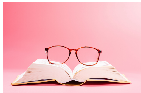
Anglais secondaire 5