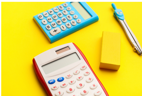
Mathématiques TS secondaire 4