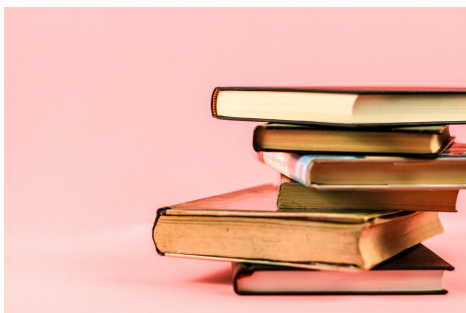
Anglais secondaire 4